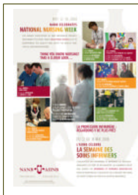
L’Affiche de la semaine des soins infirmiers 2008

Félicitations aux gagnants, et merci à tous les membres qui ont contribué au succès de ce projet.